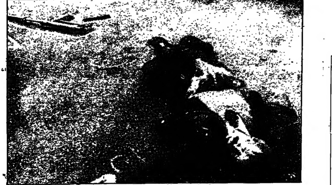
من نتائج اعمال المنظمات الارهابية في ايطاليا

الكشف رجال الشرطة الايطاليون قاعدة هامة تابعة للاوية الحمراء نسي والتي والعشرين من شهر ايار في احدى الضواحي السكنية في شمال روما، وبعين الموقوفين انها قد تكون المقر الرئيسي لفرع المنظمة الارهابية في العاصمة ايطالية، وقد يكون قد اقيم فيها عدد من ضحايا الاوية الحمراء البارزين. وقد عثر في هذه القاعدة على اربع بنادق ومدافع رشاشة وبنادق رشاشة صغيرة وبنادق مزودة بنظار دقيق وخمسة عشر كيلو غراما من التفجرات وخمسة وعشرين مسدسا وخمسين مسدسا كاسا للصوت واجهزة ارسال وكذلك على خمسين مليون ايرة ايطالية.